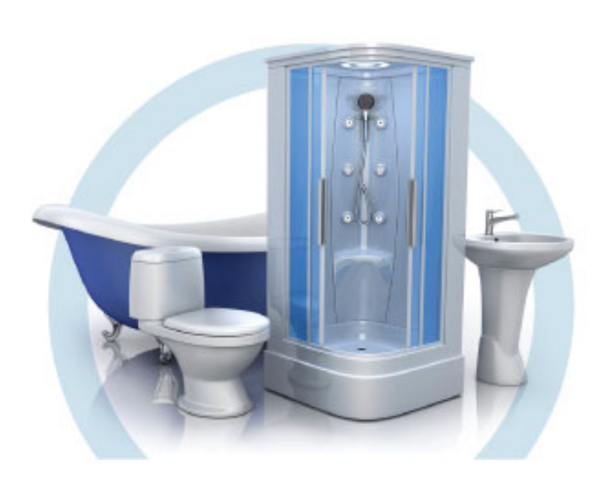
ТУАЛЕТ (УНИТАЗ, ВАННА, ДУШЕВАЯ КАБИНА, БИДЕ)