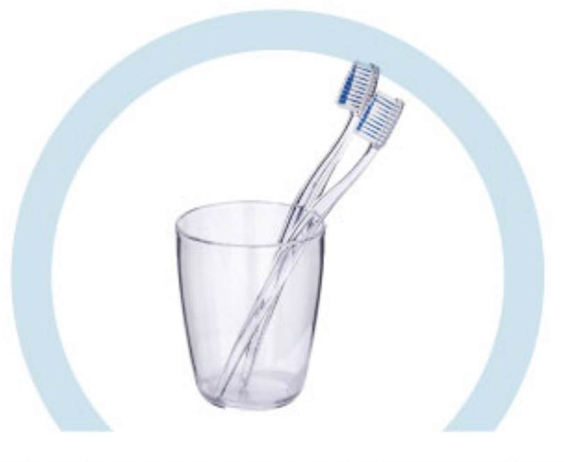
ТУАЛЕТНЫЕ ПРИНАДЛЕЖНОСТИ (ЗУБНЫЕ ЩЕТКИ, РАСЧЕСКИ И ПР.)