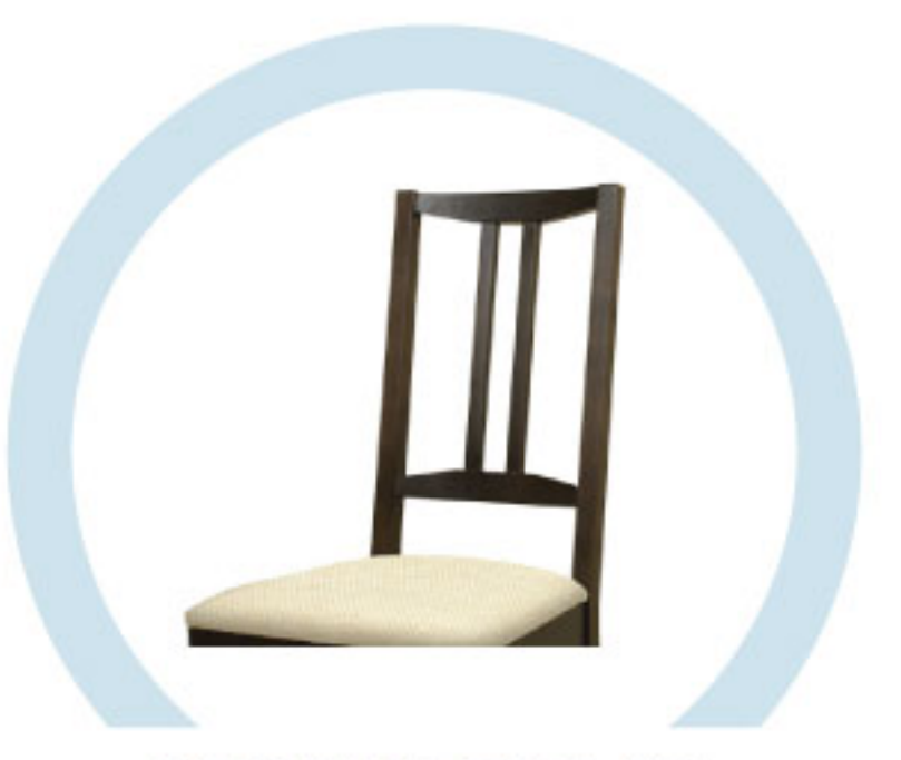
СПИНКИ СТУЛЬЕВ, НЕ ОБИТЫЕ ТКАНЬЮ И МЯГКИМ ПОРИСТЫМ МАТЕРИАЛОМ